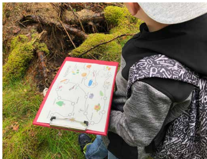
Der ESF fördert soziale Projekte, etwa das walddpädagogische Angebot der gemeinnützigen Zeltplatz Friedensau GmbH.