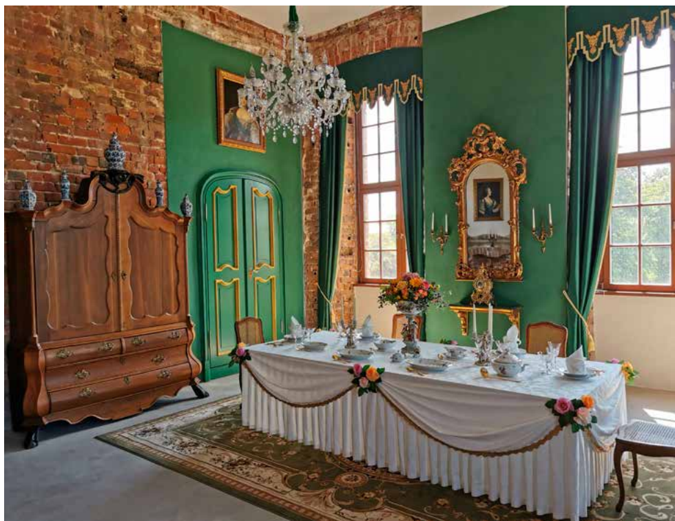
EFRE-Mittel für den Erhalt von Schloss Zerbst: Fürstin Johanna Elisabeth, die Mutter von Zarin Katharina II., residierte in einem Appartement mit diesem „Grünen Kabinett“.

Über den Multifonds-Ansatz sind vielfältige Projekte denkbar. Allerdings wird nur ein kleiner Teil der Ideen eine Zusage bekommen, denn das Budget ist begrenzt. Die LAG muss zudem abwägen, mit wel-